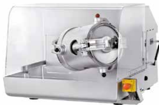
TURBULA® T10B in Sonderlackierung TURBULA® T10B with special coating TURBULA® T10B avec peinture spéciale