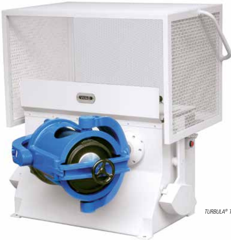
TURBULA® T 50 A