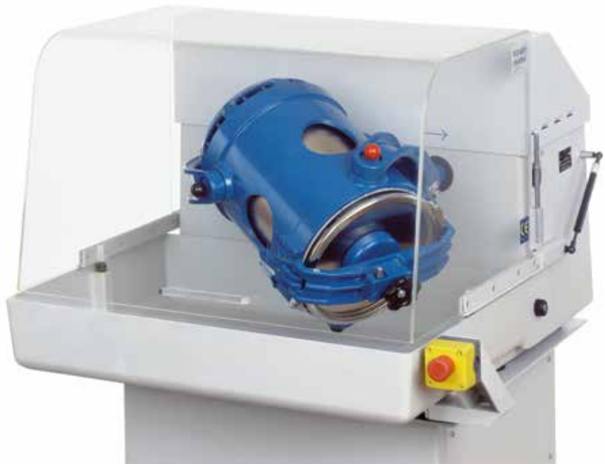
TURBULA® T 10 B