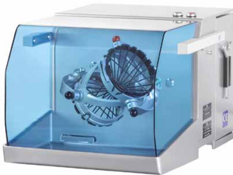
TURBULA® T2F mit FU, in Sonderlackierung TURBULA® T2F with FC, with special coating TURBULA® T2F avec CF, avec peinture spéciale

Le mélangeur TURBULA® T 2 F est utilisé dans toutes les industries et domaines, particulièrement en recherche, développement et analyse.