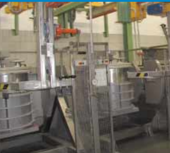
dyna-MIX mit Elektrohängebahn bei VARTA in der Batteriefertigung

En coopération avec différentes entreprises, nous possédons également un grand savoir faire en amont et en aval du procédé de mélange. N'hésitez pas à faire appel à l'expérience de nos spécialistes pour trouver une solution adéquate à votre processus de mélange.