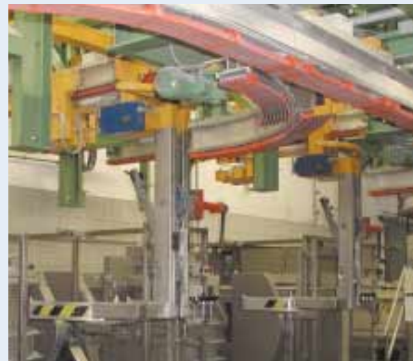
dyna-MIX avec convoyeur aérien chez VARTA pour la fabrication de piles