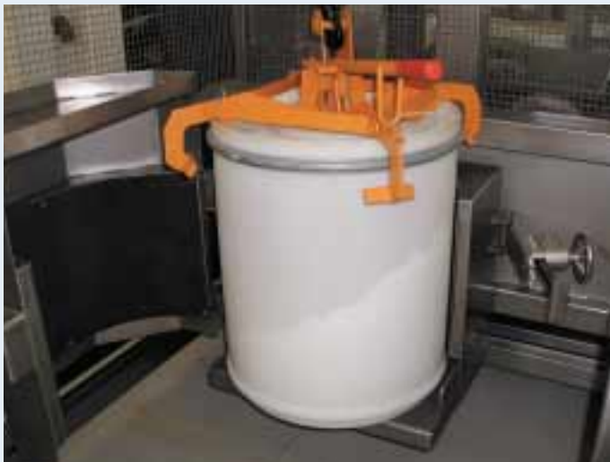
Fassgreifer für den dyna-MIX 200